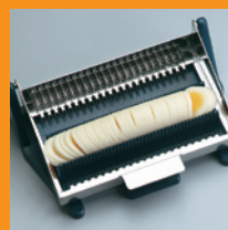
Eirol - snijder

10 x 300 g Bewaring min -18°C Houdbaar 12 mnd