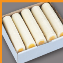
Eirol - colli

10 x 300 g Bewaring min -18°C Houdbaar 12 mnd