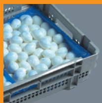
Polyzak in retourfust