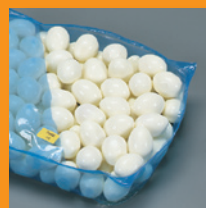
Polyzak in doos