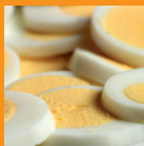
Ei-schijfje in Vers tray

24 Eieren in schijfjes Bewaring max 4°C Houdbaar 21 dgn np