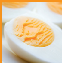
Half-ei in Vers tray

24 Eieren / 48 x Half-ei Bewaring max 4°C Houdbaar 21 dgn np