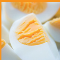
Ei-partje in Vers tray

24 Eieren / 96 x Ei-partje Bewaring max 4°C Houdbaar 21 dgn np