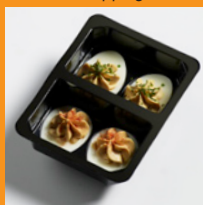
Vers tray - Retail standaard topping

tapas / borrelhapje brood of sandwiches garnering op koude schotel