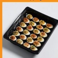
Vers tray - Foodservice standaard topping