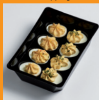
Vers tray - Retail standaard topping