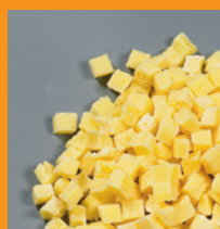
Omelet blokjes IQF 10x10 mm

10 kg / 250 kg palletbox Bewaring min - 18°C Houdbaar 12 maanden