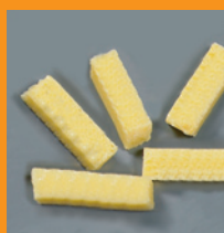
Omelet strip IQF 5x5x20 mm

10 kg / 250 kg palletbox Bewaring min - 18°C Houdbaar 12 maanden