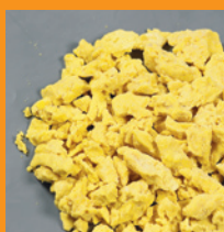
Oosterse omelet IQF

10 kg / 250 kg palletbox Bewaring min - 18°C Houdbaar 12 maanden