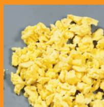
Roerei IQF roerbak

10 kg / 250 kg palletbox Bewaring min - 18°C Houdbaar 12 maanden